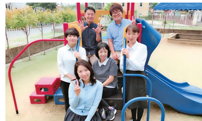
保育園職員(ふくおかライフレスキュー事業 サポーター)と一緒に!

現在は、東青葉保育園の園長を務めています。園の立ち上げ当初は、私も職員も子どもたちも何もかもが初めてのことばかりで戸惑うこともありましたが、基本理念に基づきみんなで何度も話し合って保育の行動指針を作り上げ、今では職員全員が同じ目標を持って業務に携わっています。