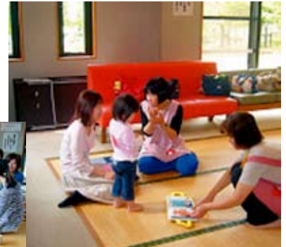
育児相談中 気軽に相談ができます