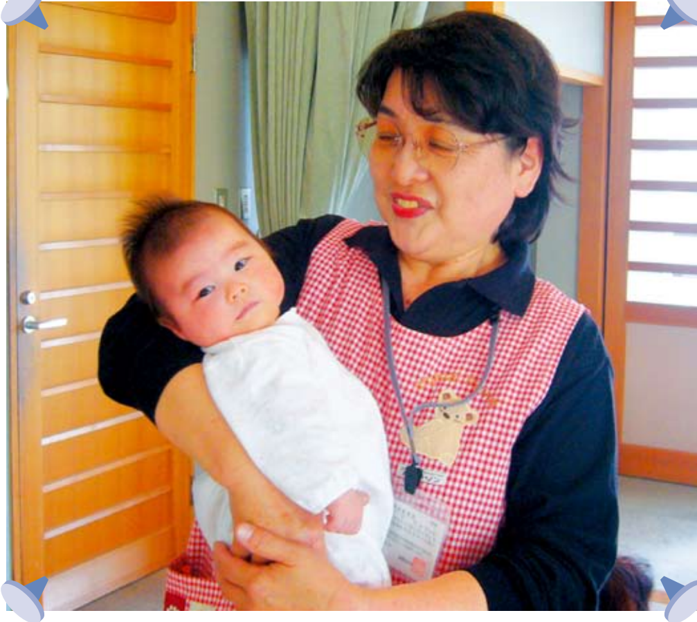
久留米市子育てサロン「この指とまれ」