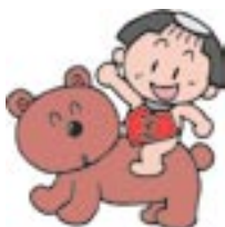
子育て支援者研修会「子育て支援にかたろう」(行橋会場)託児室