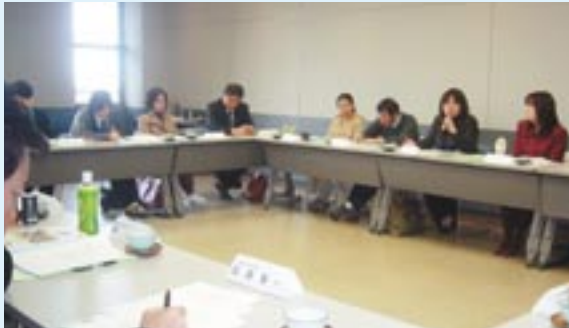
▲ 第3回連絡会議の様子(3月20日開催/春日市)