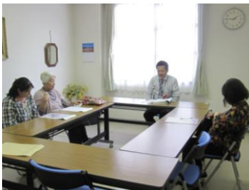
【実習】施設で傾聴を体験