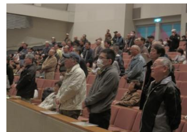
【家族の絆に関する講演会】 那珂川町の「亭主力」はいかに？