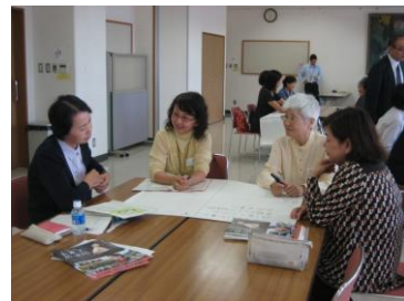
【フォローアップ】振り返り