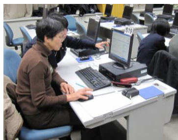
【ちょっと聞きたいパソコン講座】 女子商の生徒さんが先生に！