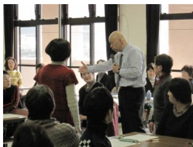
【生活支援サポーター講座】 話す時の距離はどのくらい？