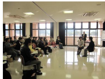
【実践講座】公開傾聴体験