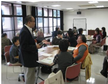
【実践講座】グループで話し合い