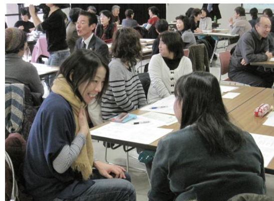
【生活支援サポーター講座】 相づち、うなづきしながらコミュニケーション