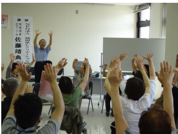
サロンサポート「さくら隊」養成研修