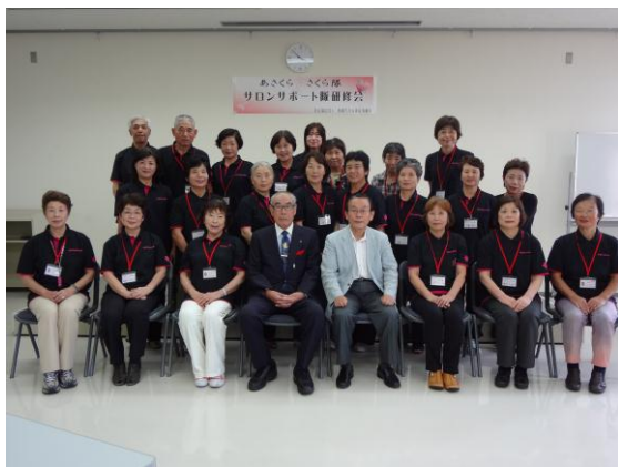
サロンサポート「さくら隊」発会式