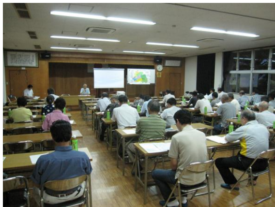
サロン紹介DVDを使っの地区説明会