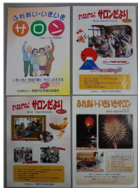
サロンのすすめパンフレットとサロンだより