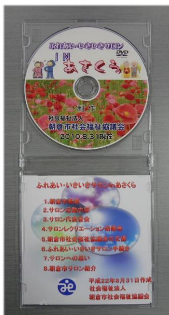
朝倉市サロン紹介DVD